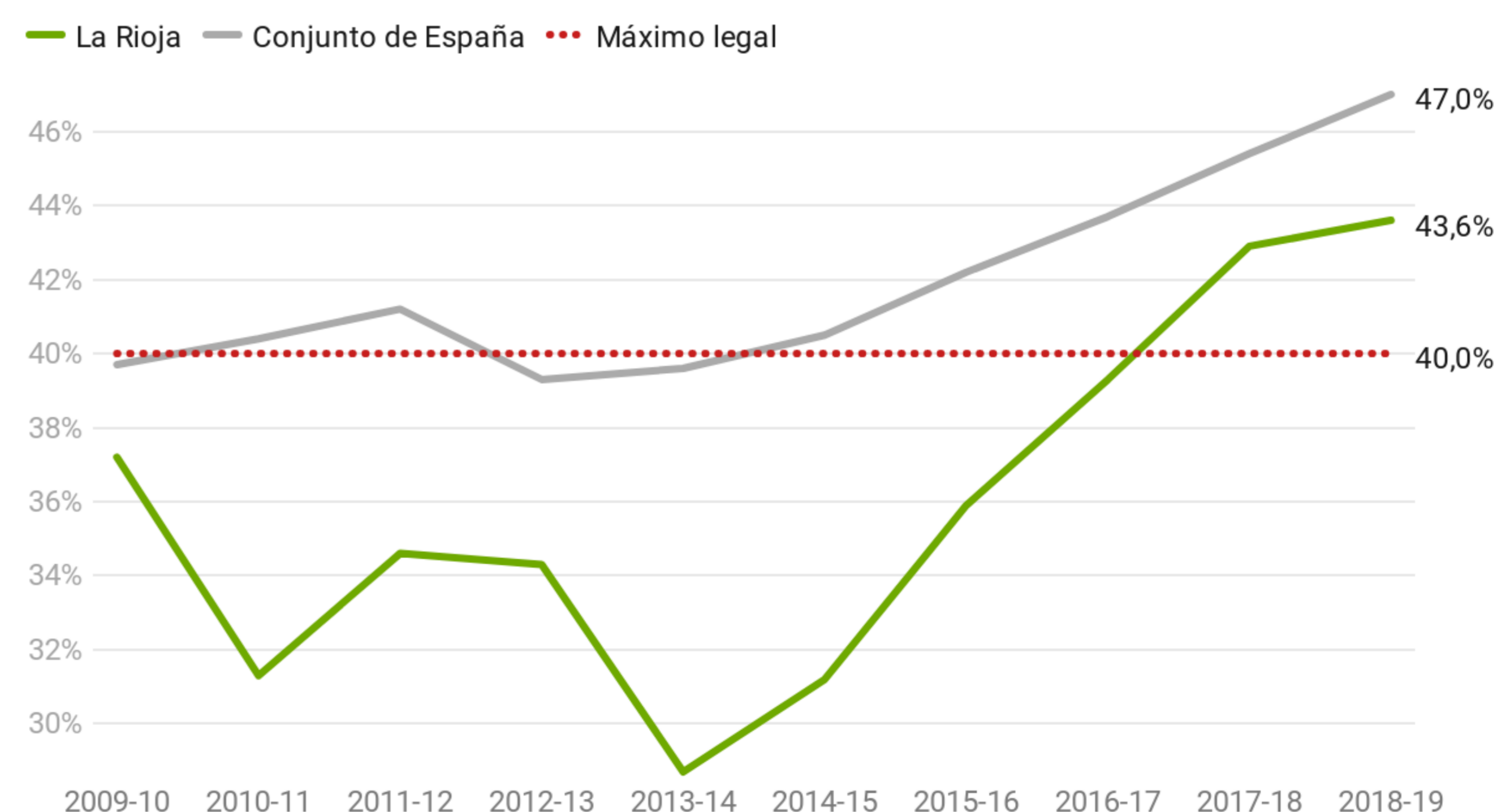
Porcentaje de PDI temporal sobre PDI total